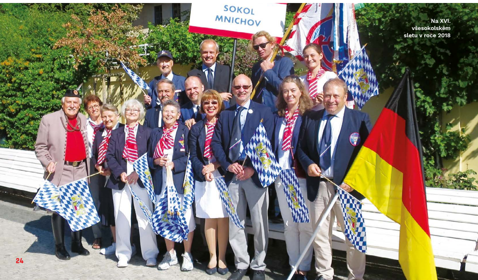
Na XVI. všesokolském sletu v roce 2018